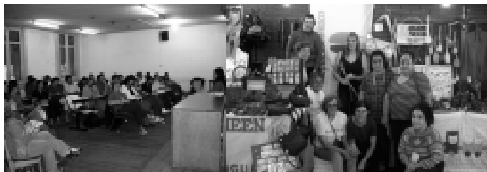
Izquierda: El Consejo sesionando en la Facultad de Derecho, Universidad de la República. Derecha: Stand de la II Muestra Canaria de Economía Solidaria en las Criollas del Prado