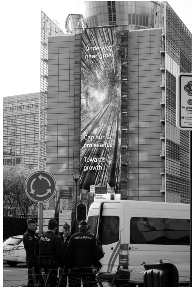
«Más allá del crecimiento»: la Comisión Europea en Bruselas. (Fotografía de Filka Sekulova del Edificio Berlaymont, sede de la Comisión Europea en Bruselas, marzo de 2014)