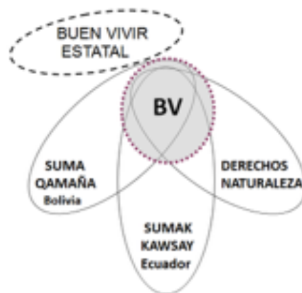
Figura 2. Representación esquemática de las variedades sustantivas y originales del Buen Vivir y las nuevas versiones de cuño estatal. Estas últimas no se superponen con la plataforma del Buen Vivir, ya que no comparten conceptos clave, tales como los valores propios en la Naturaleza o su rechazo al mito del crecimiento económico.

Por ejemplo, en Ecuador, el gobierno de Rafael Correa alentó una versión del Buen Vivir entendido como una variedad de socialismo que fuera compatible con una intensiva apropiación de recursos mineros y petroleros para exportar, mientras persistía la retórica de una buena vida en comunidad. En Bolivia, la administración de Evo Morales presentó otras nuevas versiones donde se desconectaba el Buen Vivir de sus experiencias locales para, por ejemplo, defender los derechos de la Madre Tierra a nivel planetario. Ese giro le permitía sostener una retórica anticapitalista en los foros internacionales, reclamando un respeto ecológico para toda la biósfera, mientras dentro del país, a nivel local, se violaban esos derechos de la Madre Tierra con enormes emprendimientos extractivistas. Rafael Correa llegó a sostener, por ejemplo, que si Karl Marx estuviera vivo y viviera en América Latina, sin duda sería minero o petrolero.