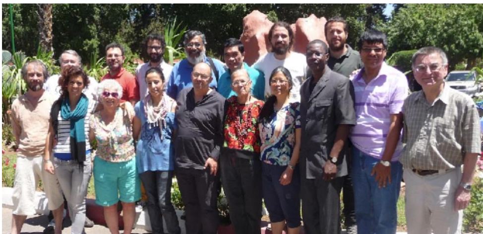
คณะกรรมการบริหาร RIPESS (เครือข่ายระหว่างทวีปเพื่อการส่งเสริมเศรษฐกิจสังคมสมานฉันท์) ณ มาร์ราเกช ประเทศโมร็อกโก เดือนเมษายน ค.ศ. 2014