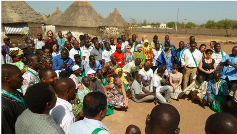
เวที Nyéléni เรื่องการเกษตรเชิงนิเวศ ปี ค.ศ.2015

อริปไตยทางอาหารหมายถึงความสัมพันธ์ทางสังคมแบบใหม่ที่ปราศจากการกดขี่และความไม่เท่าเทียมกันระหว่างชายและหญิง ประชาชน กลุ่มเชื้อชาติ ชนชั้นทางสังคม และช่วงวัย”