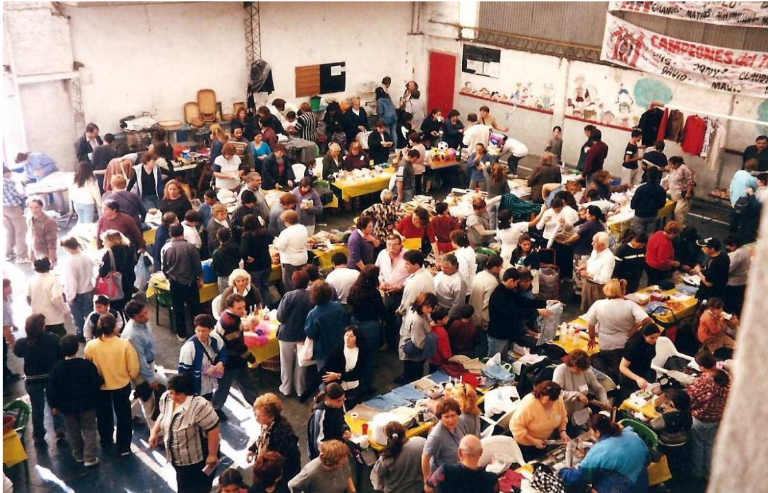
Figura 6. Vista amplia del nodo de trueque situado en calle Primera Junta 876, de Ciudad Madero, en la zona Oeste del conurbano bonaerense, correspondiente al partido de La Matanza. En los momentos de gran apogeo las ferias llegaron a reunir a más de 5000 personas diarias y fue, sin duda, la estrategia que permitió a amplio sectores de la clase media empobrecida poder sortear aquel difícil invierno de 2002.

La importancia que tenía la participación en el trueque y la posibilidad de abastecerse difería según los distintos estratos sociales. En el caso de los sectores medios, que normalmente disponían de ciertos ingresos monetarios y no se encontraban en una situación de extrema necesidad, el uso paralelo del trueque les permitió obtener un mayor rendimiento de sus ingresos, mantener cierto nivel de vida y no caer en la pobreza profunda. Vivían del trueque y podían reservar sus ingresos monetarios para los bienes y servicios que no se conseguían por créditos, por ejemplo para el pago de las cuentas mensuales de gas, luz, etcétera.