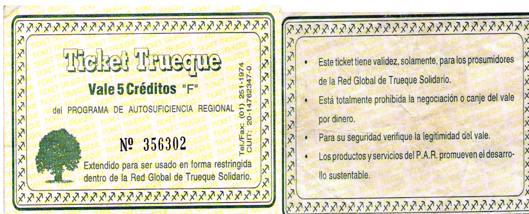
Figuras 1 y 2. Ticket de trueque por valor de 5 créditos equivalente a 5 pesos, correspondiente a la Red Global de Trueque Solidario. Muchas personas conservan gran cantidad de tickets sin ningún valor al desaparecer el fenómeno. Fotografía realizada por la autora del anverso y reverso de un «crédito» de los llamados «del arbolito».

En Argentina, si bien el hambre no constituía un tema social relevante, sí comenzaba a serlo el desempleo, por lo que el trueque aparecía como una alternativa frente a una necesidad social. Se comenzaron a reunir los sábados, concurriendo aproximadamente unos sesenta participantes. Durante sus primeros seis meses de vida, el club de trueque de Bernal evolucionó en medio de una atmósfera de entusiasmo local: «... Por turno, los socios ingresábamos a un sector donde dejábamos diversos productos como tartas, empanadas, pizzas, artículos de vestimenta y artesanía, descontándose el consumo personal del saldo de la tarjeta [los datos se manejaban en planilla de cálculo]» (De Sanzo 1998: 9).