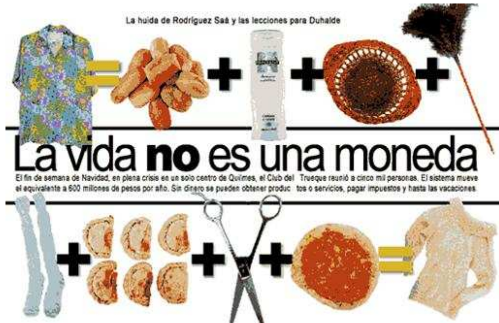
Figura 9. Una imagen de la Revista 23 en donde se habla del trueque; allí se daba cuenta de la importancia del fenómeno y se reseñaba que sin dinero se podían obtener productos o servicios, pagar impuestos y hasta las vacaciones. Portada de Revista 23 , Buenos Aires, Argentina. 4 de enero de 2002.

Dora Domínguez, 10 enfermera y actualmente empleada como personal administrativo, nos describe el proceso seguido en el primer club de trueque creado en San Nicolás, en el barrio Güemes: