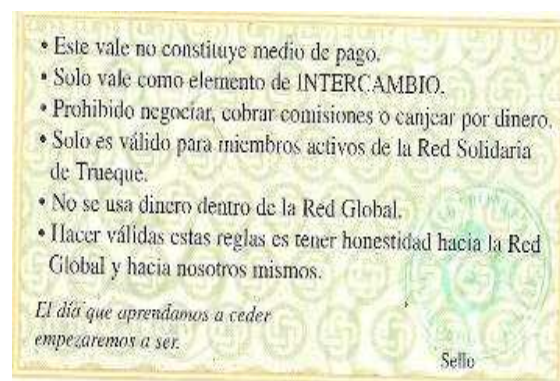
Figuras 4 y 5. Anverso y reverso de un ticket por valor de 5 créditos correspondiente a la Red de Trueque Solidario. En esta red se hace especial hincapié en el valor de intercambio y no monetario de los mismos.