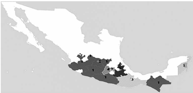
Gráfica 2. Distribución territorial de las universidades que enseñan explícitamente ESS