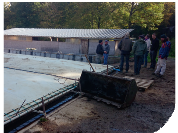
L'auto-construction est de mise en méthanisation paysanne.

L'ARDEAR Midi-Pyrénées n'est pas partie de rien : plusieurs agriculteurs s'étaient déjà lancés dans la méthanisation paysanne. L'association de développement s'est donc attachée à organiser des journées de rencontres pour que ces derniers puissent mutualiser et capitaliser leurs expériences. Objectifs : intéresser de plus en plus d'agriculteurs et d'organismes partenaires et mettre en place une procédure commune et reproductible par les producteurs eux-mêmes, plans de construction libres de droit compris.