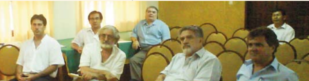
Líderes cooperativistas en Santa Cruz de la Sierra proponen referentes esenciales para el diseño de la política.