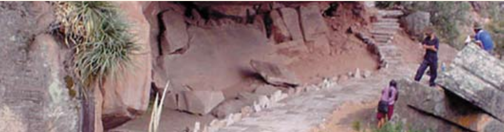
Cooperativas de turismo velan por el medio ambiente.

Promover una gestión integral de responsabilidad social, ambiental, y dignificación del trabajo en el sector cooperativo.