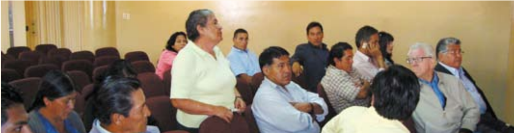
Taller de dirigentes y socios cooperativistas en Cochabamba.

En materia de integración, el cooperativismo concentra en su estructura desde las cooperativas de base hasta la Confederación Nacional de Cooperativas de Bolivia (CONCOBOL). En el Registro Nacional de Cooperativas se hallan inscritas 51 centrales de cooperativas, correspondiendo al departamento de La Paz el mayor número de ellas (57%). Por rubros corresponde al sector agropecuario el 53%, le sigue en orden de importancia numérica el sector minero con el 33.33%.