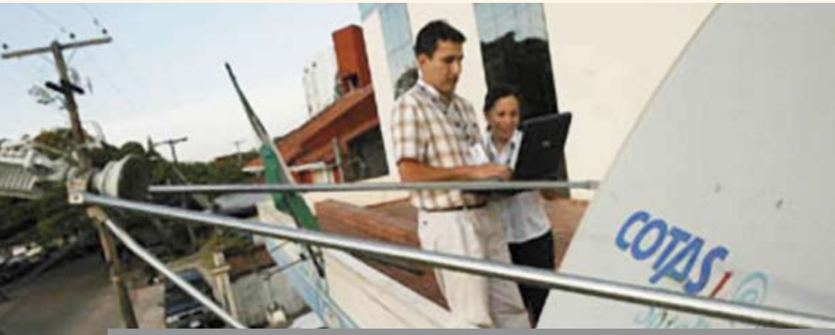
Cooperativas telefónicas en Santa Cruz de la Sierra.

La estrategia de acercamiento a los actores es un conjunto de actividades dirigidas a lograr compromiso y participación de los actores que de una u otra forma son responsables de la ejecución de la Política Nacional Cooperativa.