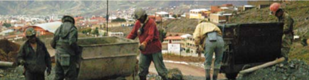
La producción cooperativa incide en la generación de trabajo.

Mejorar las condiciones para la producción de bienes y prestación de servicios de las empresas cooperativas, para que compitan con eficacia y eficiencia en el mercado.