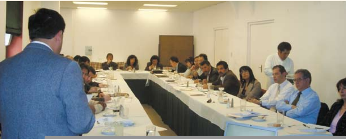
Diálogo de concertación con Instituciones del sector público en La Paz.