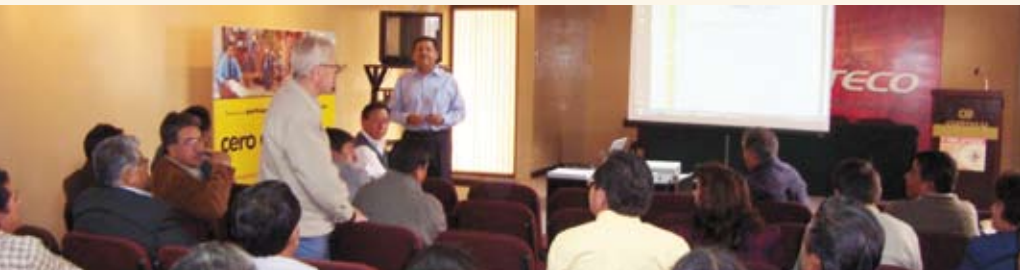
Encuentro de cooperativas en Cochabamba para concertar la política

El proceso de elaboración de la Propuesta de la Política Cooperativa se desarrolló a partir de diciembre de 2008, el Proyecto fue concluido en 13 de abril de 2009, con la presentación oficial de la propuesta de la Política Cooperativa a las autoridades del Ministerio de Trabajo. Este proceso culminó tras haberse seguido de forma rigurosa tareas emergentes de los Términos de Referencia y del cronograma de trabajo acordados y compatibilizados con los representantes del Comité de Seguimiento, conformado para esos fines.