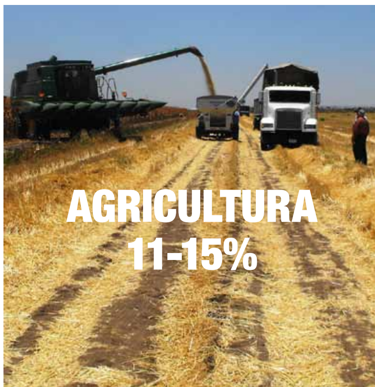
La agricultura empinadas colinas y montañas deforestadas en las Filipinas. En la parte inferior: el uso industrial de maquinaria pesada en la agricultura es responsable de las emisiones de gases de efecto invernadero más.