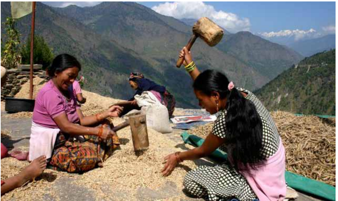
El cambio climático pone en peligro la seguridad alimentaria en las comunidades del Himalaya, como Dunche, en el distrito de Nepal Rasuwa. En esta foto mujeres Tamang trituran y criban el trigo.

Los alimentos son un promotor clave del cambio climático. El proceso industrial entre que se producen los alimentos hasta que terminan servidos en nuestra mesa implica provoca cerca de la mitad de las emisiones de gas con efecto de invernadero generados por los humanos. Los fertilizantes químicos, la maquinaria pesada y otras tecnologías agrícolas dependientes del petróleo contribuyen significativamente. El impacto de la industria alimentaria como un todo es incluso mayor: se destruyen bosques y sabanas para producir forrajes animales y se generan desechos que dañan el clima por el exceso de empaques, procesado, refrigeración y transporte de los alimentos a grandes distancias, a pesar de que millones de personas continúan con hambre.