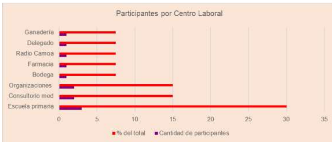
Gráfico No. 10.

Además, el 30% de los actores locales que participaron en este I Taller, pertenecen a la Escuela Primaria de la comunidad y el 15% al Consultorio médico y organizaciones de masa. Los demás pertenecen a diferentes instituciones comunitarias y del territorio.