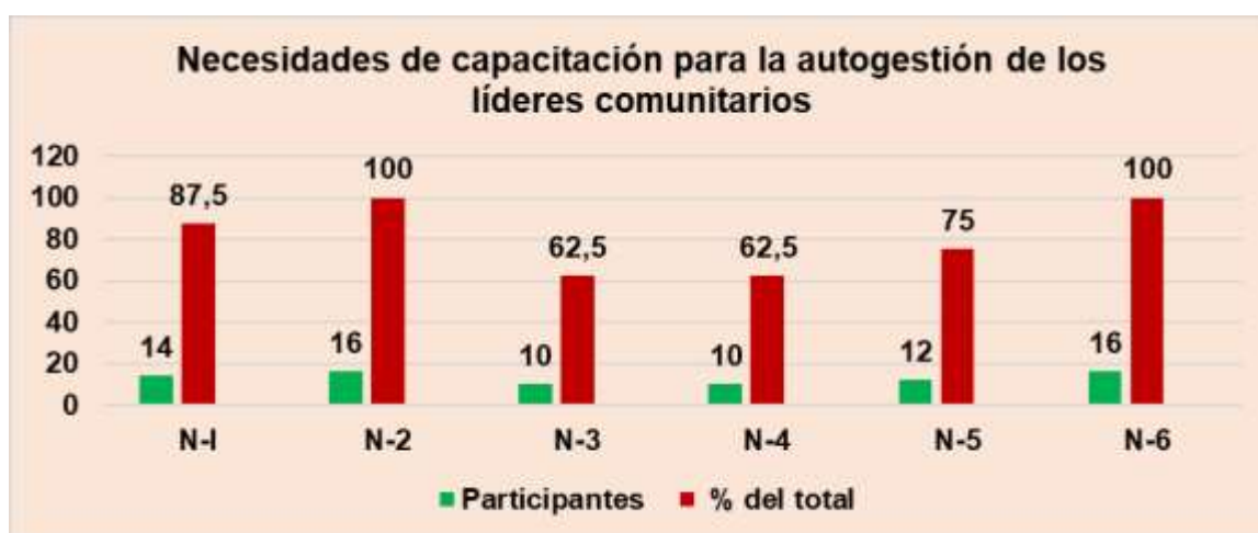
Gráfico No.11. Fuente: Elaboración Propia a partir del Trabajo en equipos en el Taller I

Fuente: Elaboración Propia a partir del Trabajo en equipos en el Taller II