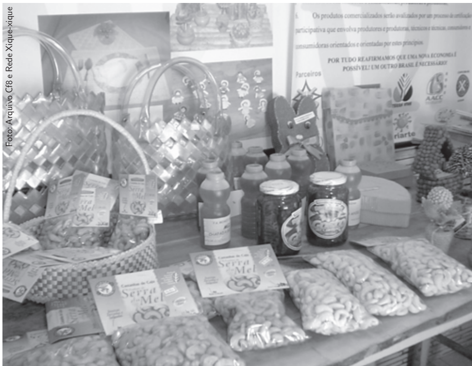
Produtos comercializado na Rede Xique-xique

A idéia é que o objetivo final não expresse apenas uma troca mercadológica de produtos, mas se situe na continuidade do processo de conscientização feito de forma participativa entre produtoras e produtores, consumidoras e consumidores, guiados pela premissa da autogestão.