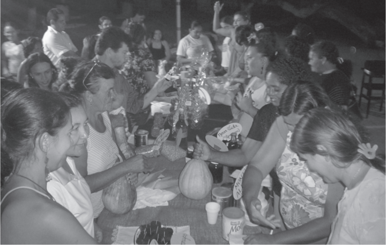
Agricultoras participando da Feira de Economia Solidária