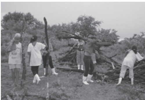
Mutirão de preparação de área produtiva

ram o trabalho de forma mais ampla, incluindo o mercado informal, o trabalho doméstico, a divisão sexual do trabalho na família, e integram a reprodução como fundamental a nossa existência, incorporando saúde, educação e outros aspectos relacionados com temas legítimos da economia" (FARIA e NOBRE, 2003, p.13).