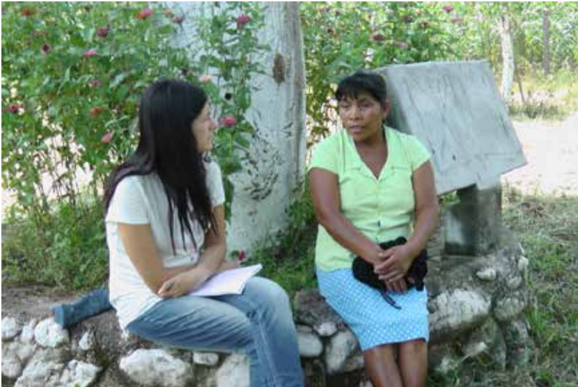
Foto 1. Entrevista a productora de La ComonYajNop Tic