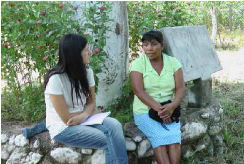
Foto 1. Entrevista a productora de La ComonYajNop Tic