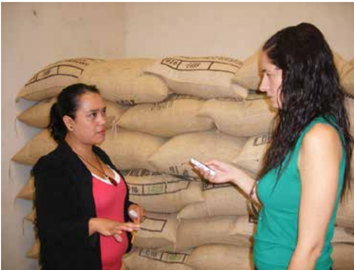
Foto 3. Cooperativa San Fernando.