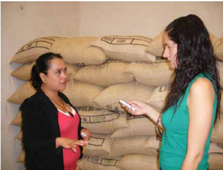
Foto 3. Cooperativa San Fernando.