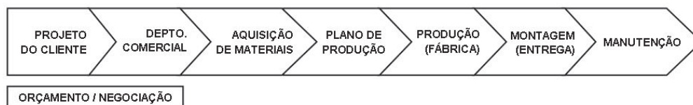
Figura 1 – Macroprocesso produtivo da Ômega

Os primeiros seis meses de existência foram os mais difíceis. Os clientes hesitavam em confiar na cooperativa. O esforço comercial foi intenso, com adoção de preços abaixo da concorrência. Percebeu-se a necessidade de integrar serviços de montagem e instalação ao processo de venda. A mudança do estatuto jurídico de cooperativa para sociedade por cotas foi motivada pela resistência da clientela, pela supressão dos benefícios fiscais das cooperativas e pela facilidade de contratar mão de obra.